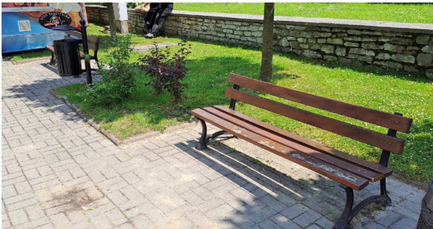
Zdjęcie 2: Ławki obok Urzędu Miasta

Stan faktyczny: Ławki obok Urzędu Miasta, gdzie mieszkańcy mogą usiąść i odpocząć.