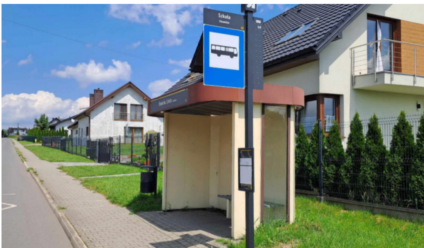
Zdjęcie 7: Przystanek Szkoła

Stan faktyczny: Przystanek autobusowy z ławeczką oraz zadaszeniem, gdzie osoby ze szczególnymi potrzebami mogą usiąść czekając na autobus.