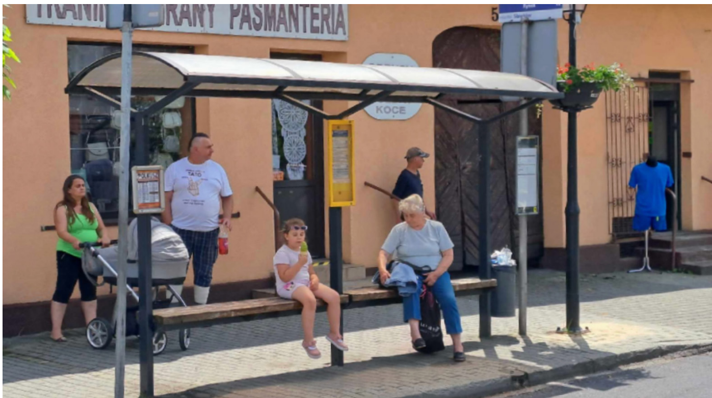
Zdjęcie 8: Przystanek Rynek

Stan faktyczny: Przystanek autobusowy z ławeczką oraz zadaszeniem, gdzie osoby ze szczególnymi potrzebami mogą usiąść czekając na autobus.