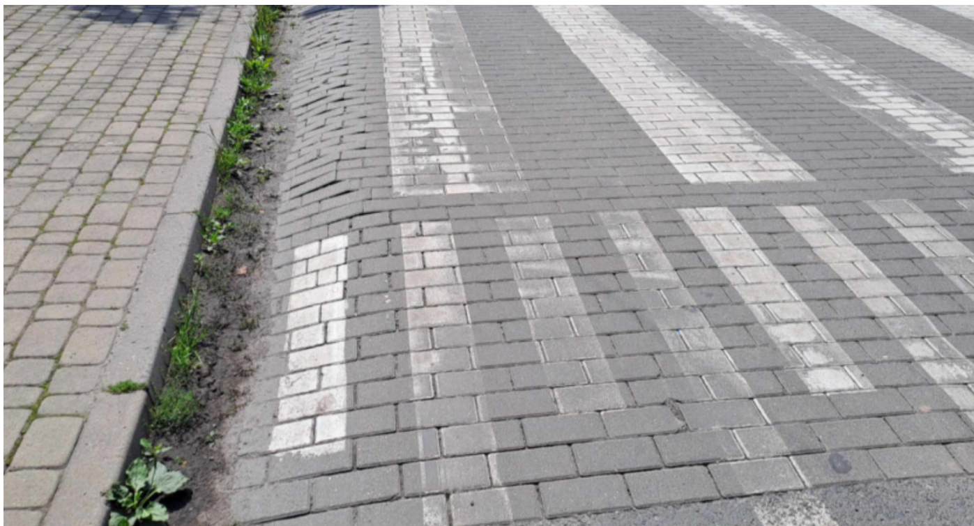
Zdjęcie 9: Przejście dla pieszych na ulicy Krakowskiej

Stan faktyczny: Przejście dla pieszych, które ma uskok w dół co uniemożliwia skorzystanie z niego osobom na wózkach inwalidzkich, a także utrudnia osobom starszym czy osobom prowadzącym wózki dziecięce.