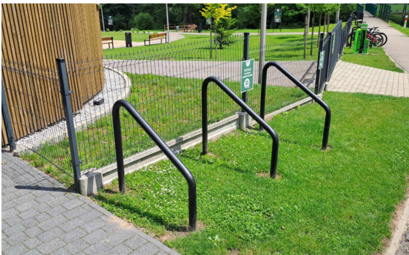
Zdjęcie 3: Stojaki na rowery przy Parku Doliny Białej Przemszy.

Stan faktyczny: Stojaki na rowery, które umożliwiają bezpieczne zaparkowanie.