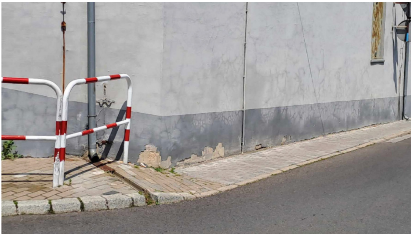
Zdjęcie 10: Chodnik prowadzący z Rynku do ulicy Legionów Polskich

Stan faktyczny: Zbyt wąski chodnik, co uniemożliwia osobom ze szczególnymi potrzebami skorzystanie z niego.