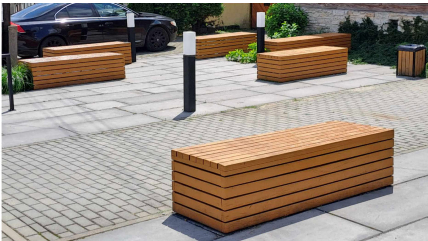
Zdjęcie 11: Ławki przy Kulturalnym Straży Miejskiej

Stan faktyczny: Drewniane ławki, które nagrzewają się od słońca bez oparcí i podparć na ręce.