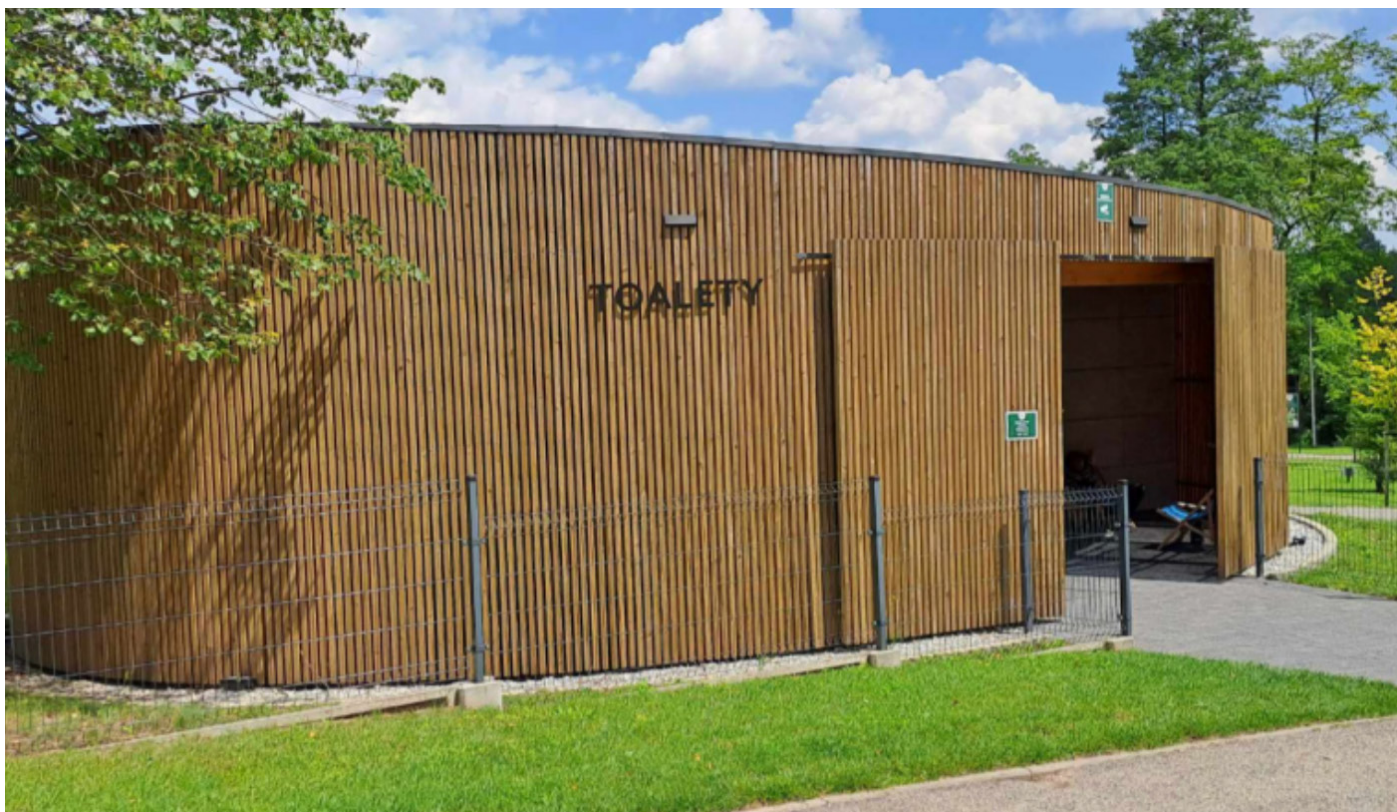
Zdjęcie 4: Toalety w Parku Doliny Białej Przemszy

Stan faktyczny: Bezpłatna toaleta, z której można skorzystać.