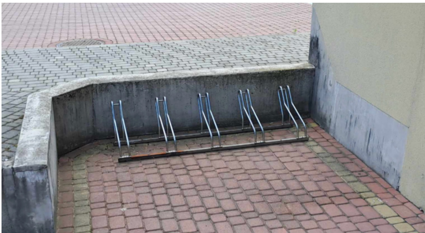
Zdjęcie 6: Urząd Miasta na Łosińskiej

Stan faktyczny: Stojaki na rowery, gdzie można bezpiecznie zaparkować.