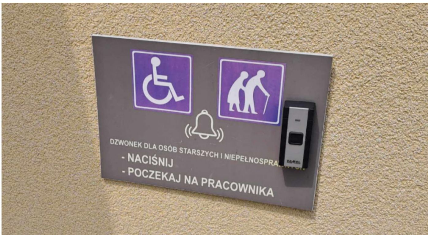
Zdjęcie 5: Urząd Miasta na Łosińskiej

Stan faktyczny: Przycisk w celu zawołania pracownika dla osób ze szczególnymi potrzebami.