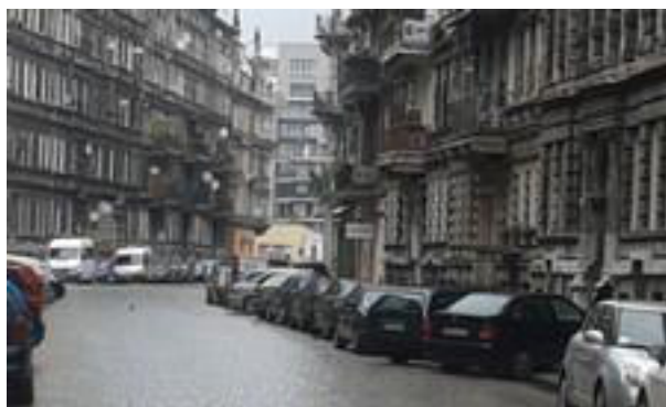
Typowe budynki zasobu gminnego na osiedlu Przedmieście Oławskie

Uciążliwe dla seniorów jest także ogrzewanie piecowe. Osoby mające tytuł prawny do lokalu lub budynku mieszkalnego mogą otrzymać dotację w wysokości 70% poniesionego kosztu na zmianę ogrzewania z węglowego na gazowe, elektryczne albo odnawialne źródło energii lub podłączenie do miejskiej sieci ciepłowniczej. Zdaniem seniorów z grupy fokusowej dla wielu zainteresowanych nawet zgromadzenie 30% kosztu wymiany ogrzewania przekracza ich możliwości.